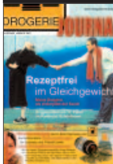
Handel: Drogisten, Reform- u. Farbenh., Lieferanten/Großh.

Mögliche Varianten für Spezialmailings in b2b-Medien