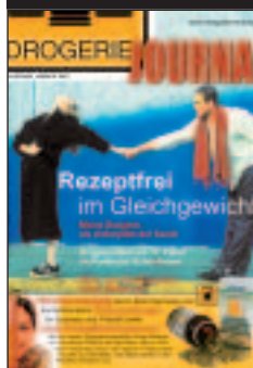
Handel: Drogisten, Reform- u. Farbenh., Lieferanten/Großh.

Mögliche Varianten für Spezialmailings in b2b-Medien