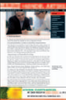
Handel: Alle Branchen Einzelhandel und Großhandel, Lief.