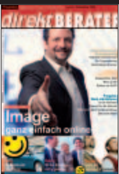
Direktvertrieb: Einpersonnen-Unternehmen, Hesteller/Lief.