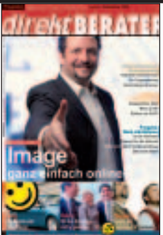
Direktvertrieb: Einpersonnen-Unternehmen, Hesteller/Lief.