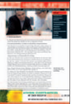
Handel: Alle Branchen Einzelhandel und Großhandel, Lief.