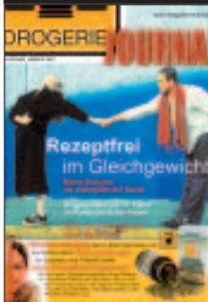
Handel: Drogisten, Reform- u. Farbenh., Lieferanten/Großh.

Mögliche Varianten für Spezialmailings in b2b-Medien